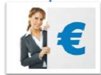
Kostenbeheersing & Verplichtingen